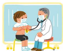
心臓の音や呼吸の音を聞きます

内科検診では、心臓の音や呼吸の音、背骨の形や胸の骨の形、ろっ骨の形などを調べます。