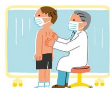
背骨・胸の骨・ろっ骨などの形を見ます